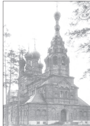
Лютиков монастырь, основанный еще в XVI веке, находился недалеко от родового имения Богдана Матвеевича