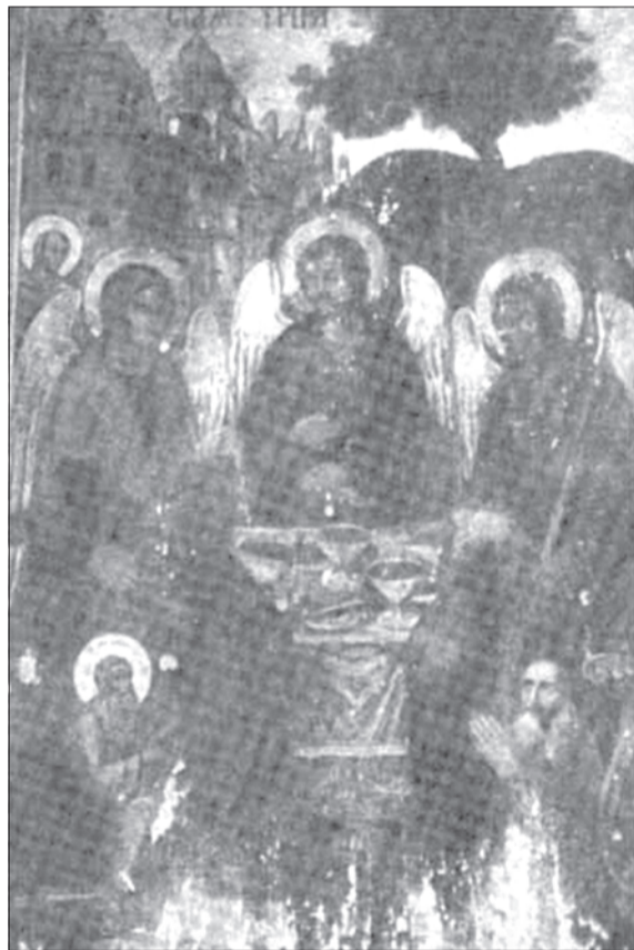
Иконы Живоначальной Троицы с иконостаса Троицкого Лютикова монастыря под Перемышлем

личные искусства и ремесла, среди которых значительное место занимала иконопись.