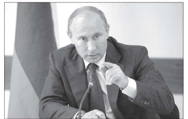
Владимир Путин, Президент Российской Федерации:

«Российская экономика должна быть конкурентоспособна. Наряду с высокой профессиональной подготовкой - это улучшение условий труда, широкое использование новых технологий, как итог - изменение структуры экономики, повышение её эффективности, рост качественной занятости и на этой базе - увеличение оплаты труда»