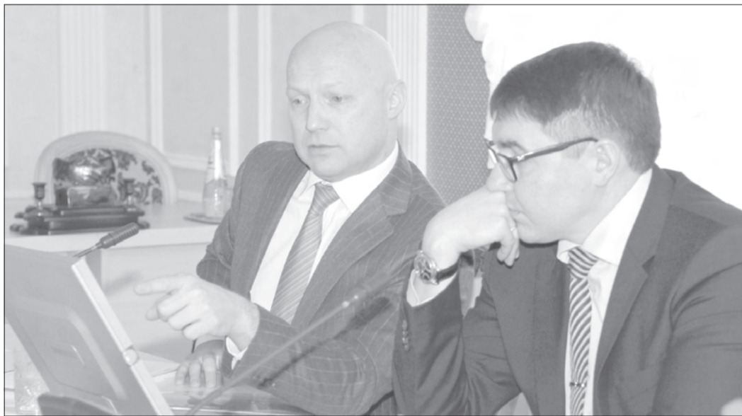
Эксперты выбрали в регионе 15 площадок для размещения многофункциональных комплексов придорожного сервиса

Проблема в том, что до недавнего времени придорожный сервис в нашей стране развивался стихийно, бессистемно. Сегодня регионы делают только первые шаги по наведению порядка в этой сфере, в том числе и Ульяновская область, где в прошлом году начала разрабатываться концепция развития придорожного сервиса. Напомним, в ноябре 2013 года в регионе проведено углубленное маркетинговое исследование земельных участков, предполагаемых под размещение многофункциональных придорожных комплексов. По