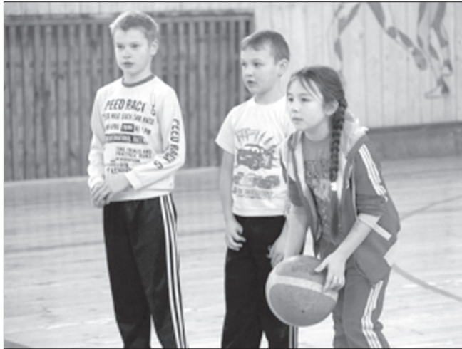
Хороший подарок ко Дню области получили жители Тагай - отремонтированный спорткомплекс: заменены кровля здания, оконные блоки, полы, отопительная система, отремонтированы раздевалки. На это из областного бюджета выделено более трех миллионов рублей.