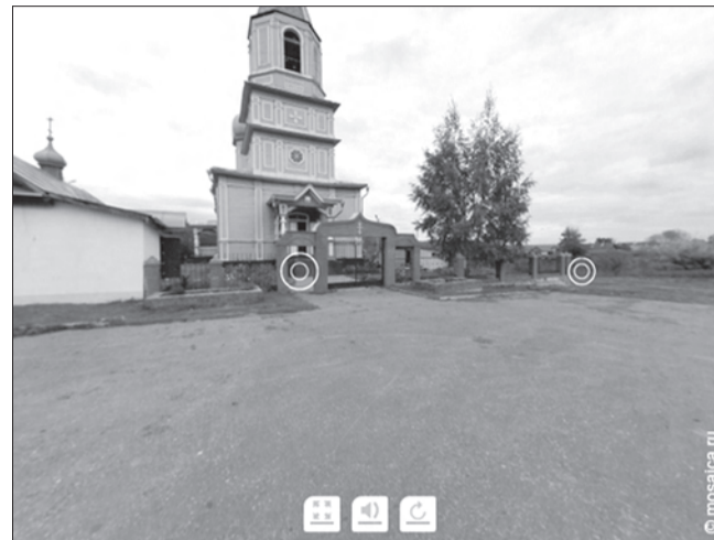
В 2013 году по региональным музеям создано 12 туров, содержащих более 30 3D-панорам. На 2014 год запланировано создание не менее 40 3D-панорам. Напомним, проект преследует цель сформировать у жителей и гостей региона интерес к объектам культуры.