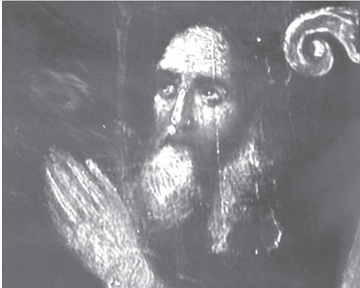
Предполагаемое изображение Богдана Хитрово. Единственный дошедший до нас портрет основателя Симбирска

Дело в том, что после основания нашего города Богдан Хитрово оставил еще один яркий след, возглавив в 1654 году Оружейный приказ. На этом посту оружейного он оставался до самой смерти в 1680-м. Как пишет краевед Владимир Гуркин, в ведении оружейного находились Оружейная палата, Золотая и Серебряная палаты, где было сосредоточено не только производство вооружения, но и раз-