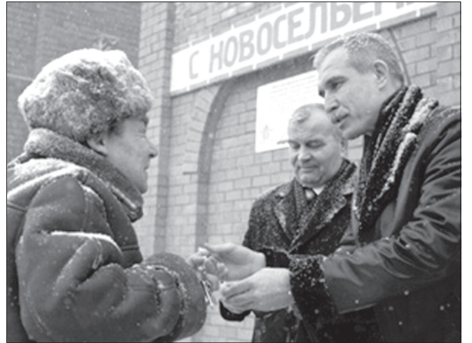
В Карсунском районе сдан дом для переселенцев из ветхого жилья. Новое многоквартирное здание возведено в поселке Языково впервые за последние 25 лет. Новоселами стали 45 человек, ключи от квартир им вручил первый зампред правительства области Александр Пинков.