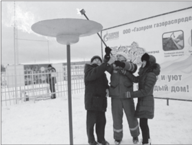
Завершена газификация села Белое Озеро Майнского района. Как сообщил зампред правительства - министр регионального строительства, ЖКХ и транспорта Александр Букин, было направлено более 10 миллионов рублей, что позволит обеспечить топливом почти 100 домов.