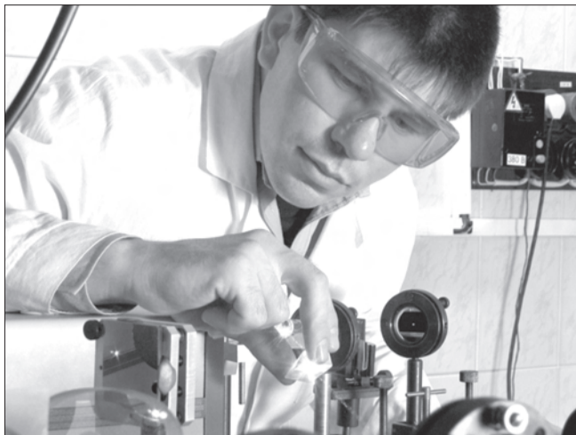
Молодые ученые из Ульяновской области выиграли гранты Президента Российской Федерации в размере 600 тысяч рублей. Сертификаты на их получение кандидатам наук из УлГУ и УлГТУ 14 января вручил главный федеральный инспектор Владимир Козин.